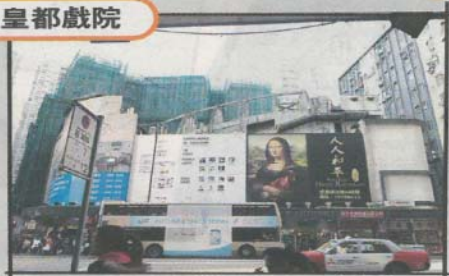
招牌後的前皇都戲院仍保持原來外貌。

Paul 哥哥：「1950 年代從內地來港、暫時棲身北角的人頗富裕，故對消閒娛樂有需求。」璇宮戲院在 1950 年代初開幕時，邀得當時的匯豐銀行主席摩士爵士擔任主禮嘉賓，可見其風光。1950 年代末期改名為皇都戲院，臨近 2000 年時結業，現時內部改成商場。